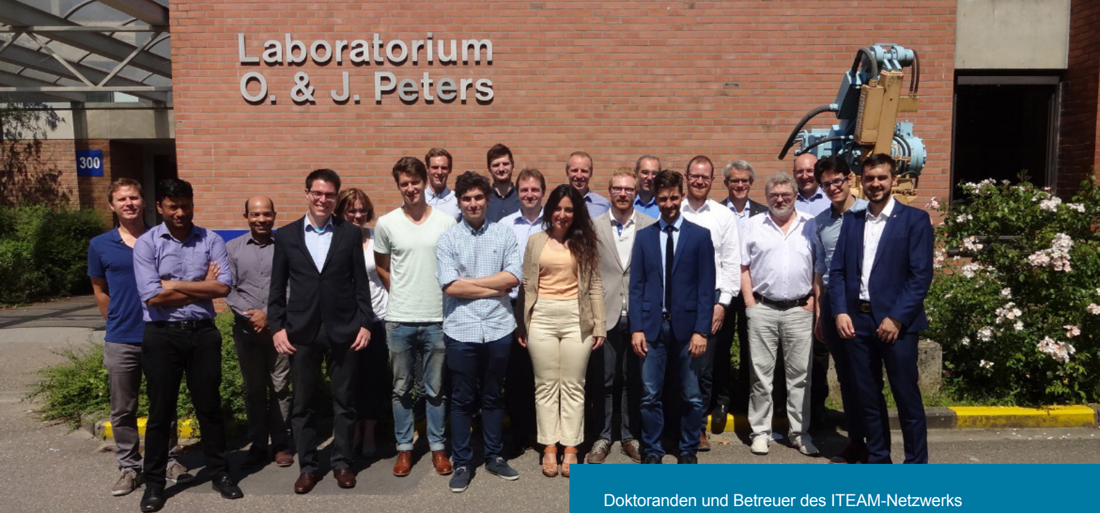
Doktoranden und Betreuer des ITEAM-Netzwerks beim Projekttreffen in Leuven